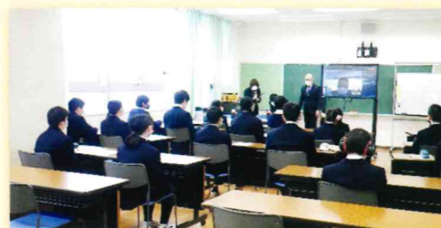
ビジネスマナー研修