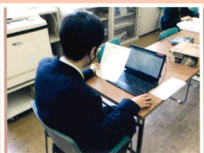
オフィスワーク班