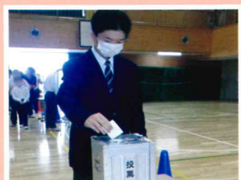
主権者教育 (総合的な学習の時間)